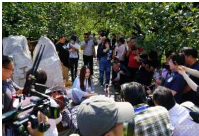
农文旅嘉年华-安徽砀山站