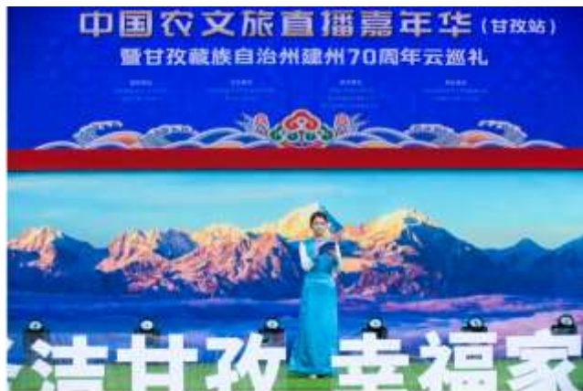
农文旅嘉年华-四川甘孜州站

通过对本地素人网红的培训，以及引入供应链，满足了直播电商发展对“人”和“物”的基本诉求。此外结合本地特色，发挥头部网红的带动效应，为直播电商营造发展氛围，构建直播应用场景，推出 “农文旅嘉年华系列直播活动” ，并在此基础上根据县域农特产品销售的需求，推出 “农文旅赶大集” 活动，重点突出直播电商上行，从而形成 宣传+上行 的两条线，助力乡村振兴。