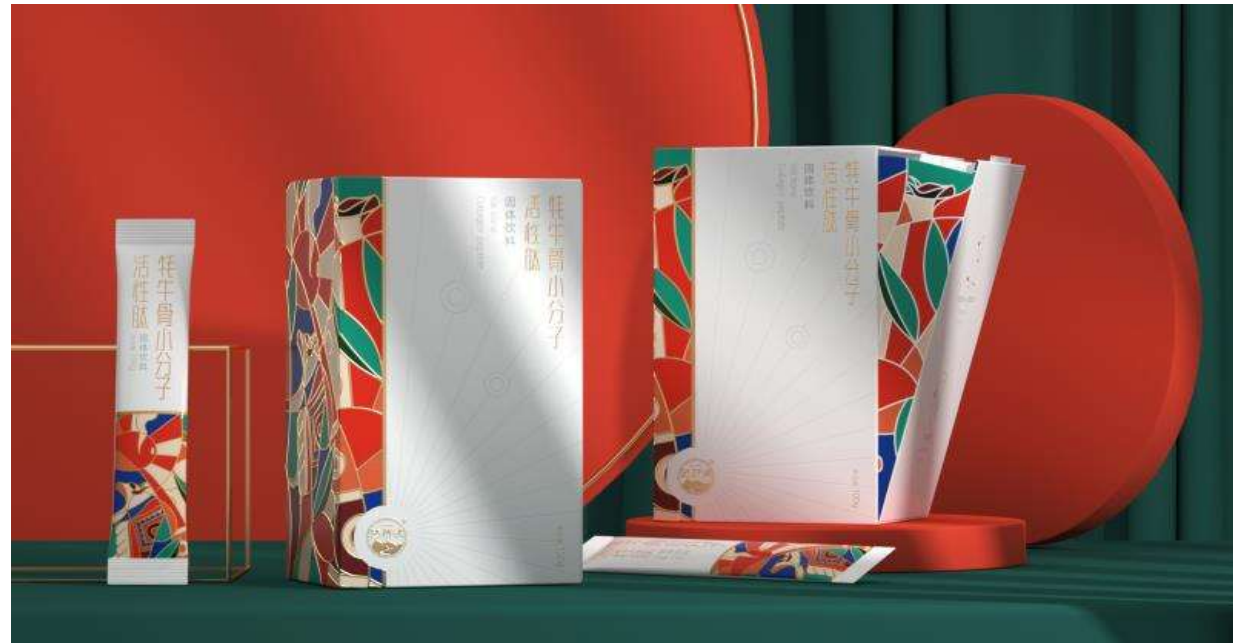
(进行产品深加工 实现深度产品再造)

产品再造包括品牌再造，包装再造，针对具有较大市场潜力的产品，会引入深加工资源，进行深度产品再造。案例：四川甘孜州牦牛骨肽，选用四川甘孜州藏区原生态无污染牦牛骨，生产出超微纳米级小分子肽。