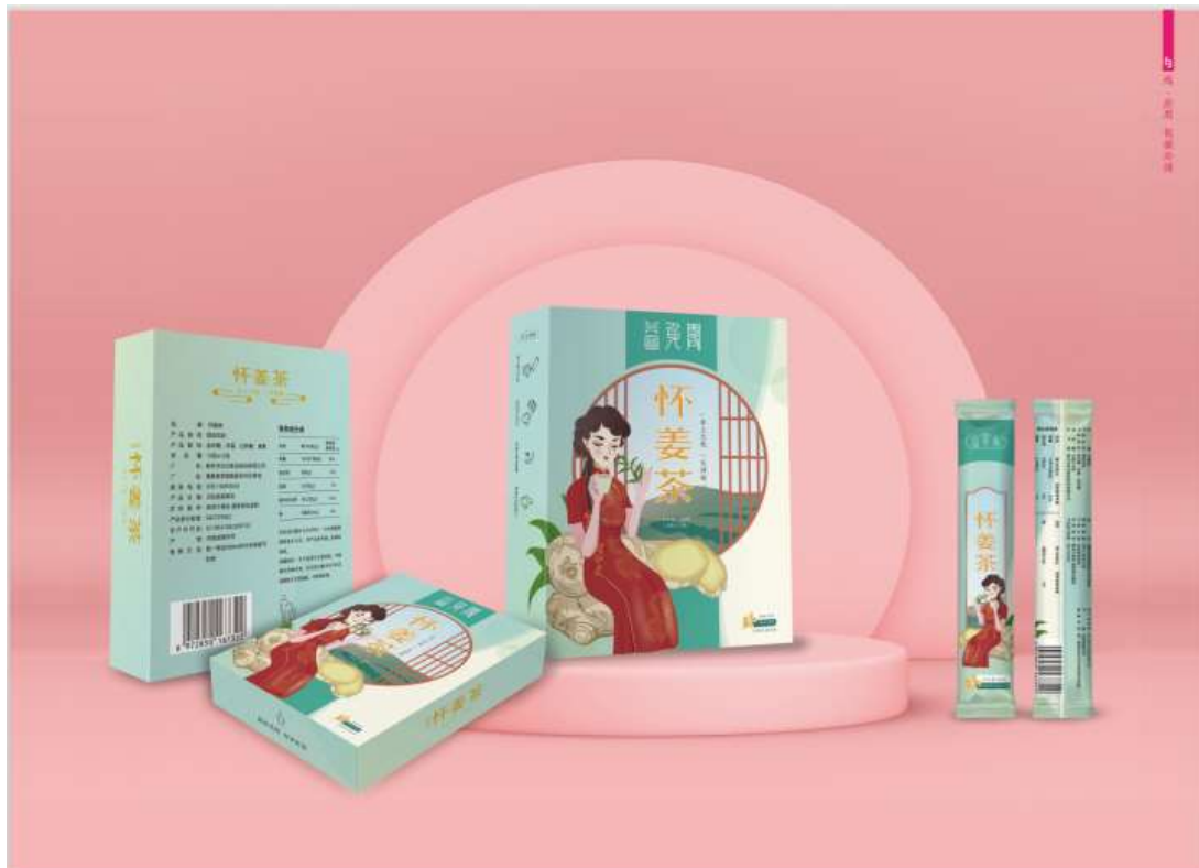
(打造互联网品牌和包装)